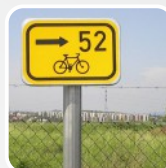
značení cyklotras a cyklostezek