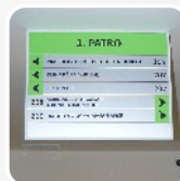
interiérové informační značení