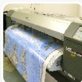
velkoplošný digitální tisk