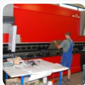
kovovýroba, ohraňovací lis do 5 m