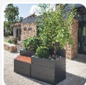
květinová výzdoba veřejných prostor