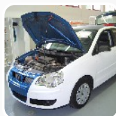
polepy vozidel, carwrapping