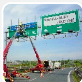
dopravní značky velkoplošné