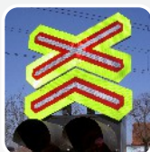
železniční značky a butony