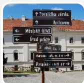
městský turistický mobiliář