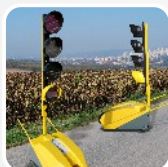
mobilní světelné signalizační zařízení