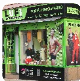
reklamní panely, polepy výloh