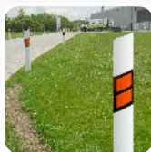
pružné směrové sloupky