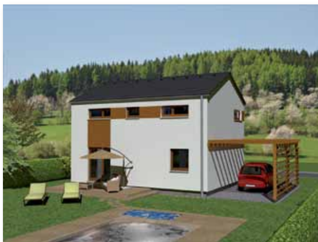
Vizualizace mají ilustrativní charakter.