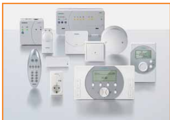
Soustava prvků Synco Living.

Výsledkem je špičkový systém automatizace domácnosti již v základní ceně domu.